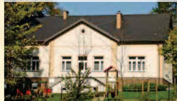
Fot. Budynek szkoły

W latach 1997–2008 etapami przeprowadzono remont kapitalny placówki, w ramach którego wykonano m.in. następujące prace: odwodniono budynek, wyremontowano piwnice, wykonano instalację c.o., wymieniono stolarkę i dach, ocieplono budynek i zrobiono elewację.