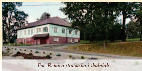
Fot. Remiza strażacka i skalniak

W 1966 r. wieś została zelektryfikowana, a do szkoły i sołtysa doprowadzono telefon, jednak jej telefonizacja miała miejsce dopiero w 1999 r., a gazyfikacja – w latach 1994–1995. Także w latach 90. zrobiono drogę asfaltową, doprowadzając ją do nowego mostu. Do centrum została przedłużona w 2001 r., a do granicy ze Staszówką w 2004 r.