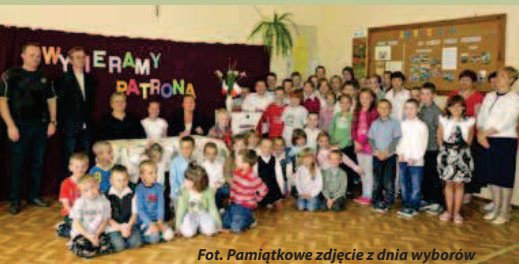
Fot. Pamiątkowe zdjęcie z dnia wyborów